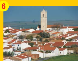
6 . Igreja Matriz de Casével (séc. XIV/XV) . Casével