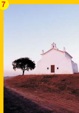
7 . Ermida de São Pedro das Cabeças (séc. XVI) . A 5 km de Castro Verde