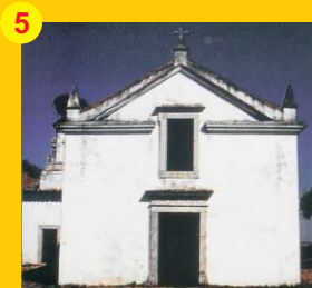
5 . Ermida de São Miguel (séc. XVIII) . A 5 km de Castro Verde . Estrada de Casével