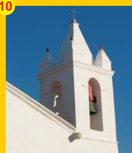
10 . Igreja Paroquial (séc. XVII) . Santa Bárbara dos Padrões