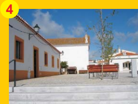
4 . Igreja da Misericórdia (séc. XV/XVI) . Entradas