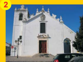
2 . Igreja das Chagas do Salvador (séc. XVII) . Rua D. Afonso I . Castro Verde