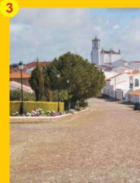
3 . Igreja Matriz de Santiago Maior (séc. XVIII) . Entradas