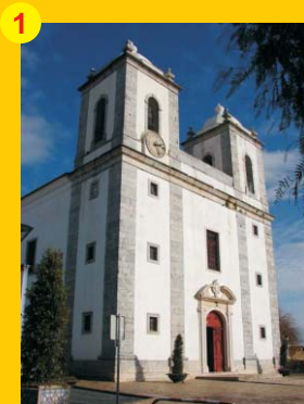
1 . Basilica Real (séc. XVI) . Praça do Município . Castro Verde